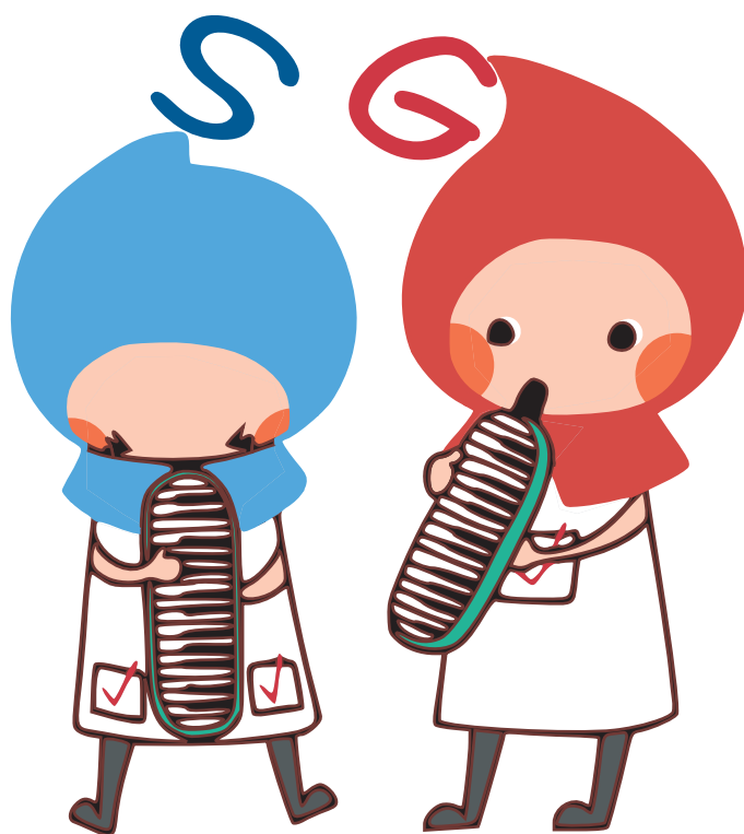
滋賀県健康づくりキャラクターハグ&クミ